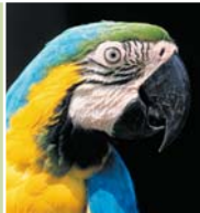
Guacamayo o ara macao