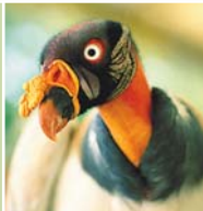
Buitre real ▶

La riqueza de sus aguas permite que tanto los pobladores nativos huarayos como los colonos asentados en las proximidades se dediquen a la pesca de doncellas, palometas, dorados, pirañas y paiches, éstos últimos sin embargo, no son una especie nativa sino que fueron introducidos en el lago. Junto con la pesca, otra de las actividades económicas más importantes de la zona es la recolección de castañas.