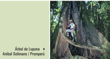
Árbol de Lupuna ▶