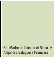
Río Madre de Dios en el Manu